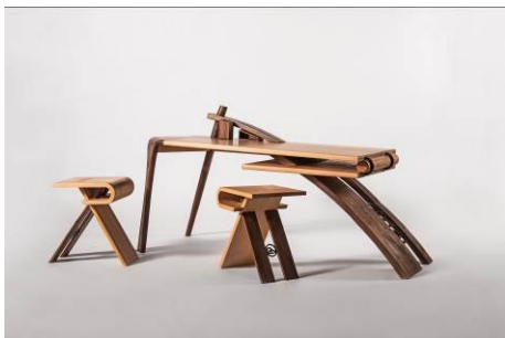
書山佐流水 | 黃怡嘉 山毛櫸、胡桃木、鐵件 | 30x30x40、30x30x40、120x60x60cm