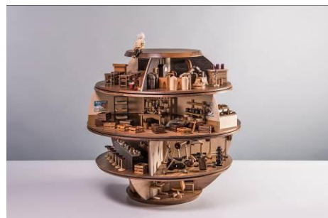
圓夢 | 蘇柏源 胡桃木、紅酸枝、柚木、山毛櫸、樹脂 | 18x14x27 cm