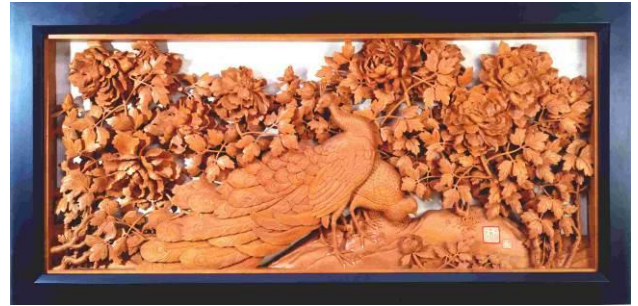
富貴長春 | 234 x122 x12 cm