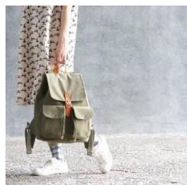
職人生活 · 品牌快閃店