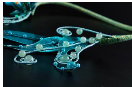
青鸞 | 東方纏