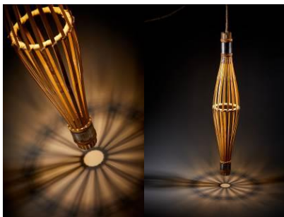
梭光系列-吊燈 | 光織屋