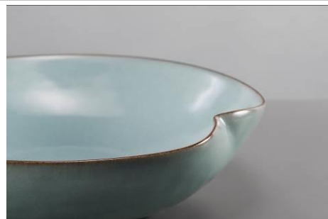
天青桃盤 | 林冠宏 台灣陶土、日本瓷土、天青釉 | 36x36x11 cm