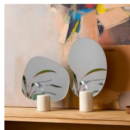
新藝商號 · 生活選物店