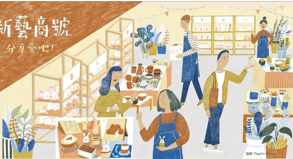
插畫 / Ting Yu Chang