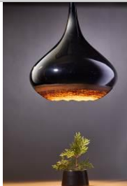
漆燈 Layer | 一鼓作器設計工作室