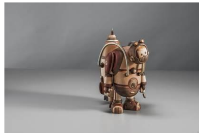
境外羅伯特 | 楊薇霖

楓木、積層竹片、曲木、天然木蠟油 | 每 54x60x76cm 將竹藝融入了木作，透過編織的方式同時保留了竹的彈性與曲木的剛性，相輔相成，發現新的可能性。