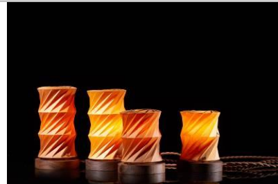
竹 | 長絲藝術