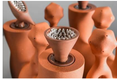
種子的旅行 | 尤雅容

桂木、楓木、橡木等 | 90x90x90、100x100x100cm 不等 描述不同生命階段的姿態，整體造型結合宇宙天文的概念，作品分四部分：初始、囚牢、探尋與平衡，強調真實自我、不忘初心。