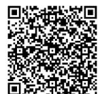
假日好食玩 ▲立即報名