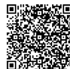
好玩藝設計講堂 ▲立即報名

展期週末現場與《潮人物》巡迴餐桌計畫共同策劃，邀請多位工藝職人開班授課，蒐羅全台可頌、台味麵包的美食快閃、似顏繪現場創作等多場「好玩藝設計講堂&假日好食玩」等您來體驗！課程統一採線上報名，額滿為止；更多活動詳情請上「2019 工藝之夢」活動網站查詢。