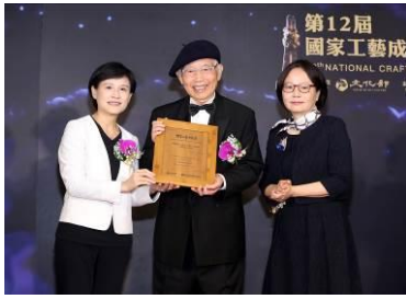
2018 工藝成就獎頒獎典禮現場