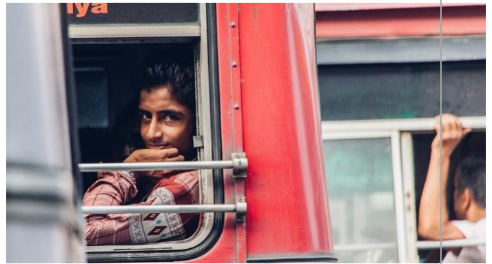
佳作 | 小鎮巴士肖像 (五張作品之一) | 許尊凱

一踏上沙灘總是積滿垃圾，像銀河般佈滿沙灘的每一個角落，台灣四面環海，海洋的資源與環境卻一直未受到人類的保護與尊重，而逐漸消失遞減。