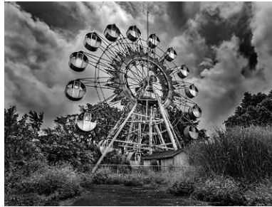
失落的樂園·黃俊金 2016 新光三越國際攝影大賽 貳獎