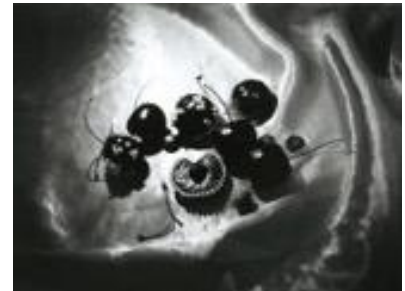
Hxxxxy Sxeex XOXO·邱庭 2016 新光三越國際攝影大賽 參獎