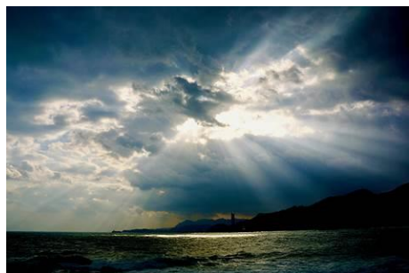
台灣東北角海岸線·2013