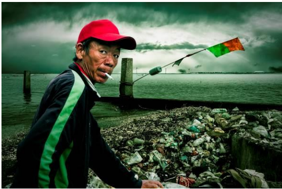
首獎 | 海灘危機 (五張作品之一) | 林誌聰

別於一般競賽單張照片決勝負的模式，採拍攝主題自訂，以「一組五張」之系列作品敘述一則影像故事；考驗攝影技巧，更挑戰參賽者對於影像編輯及創作理念的呈現。活動創辦至今已邁入第 12 年，累積募集超過 5 萬件作品，獎掖及培育國內外近 300 名攝影新秀，每年吸引眾多攝影愛好者共同參與。今年以「時光」為主題，在「時光」洪流的快速流動下，分享攝影者如何訴說影像故事的過去與未來。